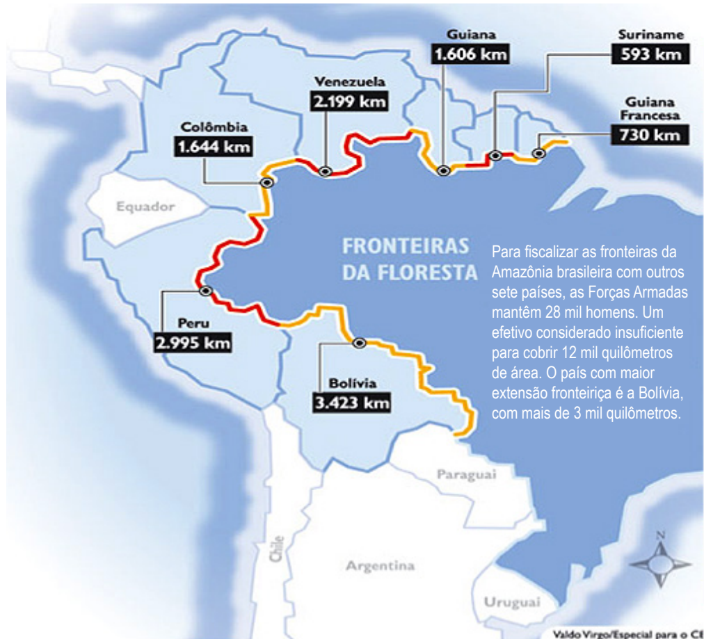
Figura 2 – Fronteras de la Amazonia Continental

de investigaciones científicas sobre la Amazonia. De ellos el 88% es producido por fuera de los países amazónicos y se encuentra repartido entre centros, instituciones y universidades de Europa y USA, con una pequeña parte en algunos otros países. El 12% proviene de la Amazonia continental. De esos 3,750 millones, el 84% proviene de Brasil y el resto de los otros países amazónicos.